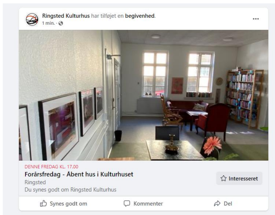
Fig. 3. Eksempel på begivenhed på Kulturhusets Facebook side.